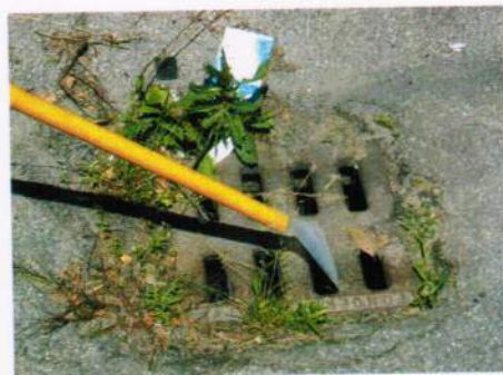
Particolare di applicazione del Sumilarv 0,5 G mediante spandigranuli

pubblico. Il piano di difesa previsto dall'amministrazione comunale ha considerato come obiettivo primario il trattamento di tutti i possibili microfocolai (in particolare tombini e caditoie) presenti nell'area urbana. Con questa strategia si è inteso frenare la crescita demografica della zanzara e impedire l'infestazione dei giardini privati da parte di zanzare originatesi sul territorio comunale. Il censimento effettuato nel centro urbano ha rilevato la presenza di 4700 caditoie, di cui 3760 a griglia e 940 del tipo "a bocca di lupo". La necessità di definire una programmazione degli interventi è stata presa a spunto per impostare una prova volta ad individuare le con-