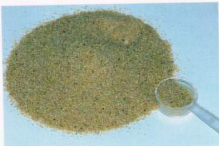
Microgranulo a lenta cessione del Sumilarv 0,5 G

Ad esempio, l'elevata temperatura media che ha caratterizzato la stagione primaverile-estiva 2003 ha portato nel territorio comunale ad un livello di infestazione da Zanzara tigre , e relativa molestia, decisamente percepibile da residenti ed ospiti. In particolare, la zanzara nel territorio di Montegrotto Terme si avvale di una diffusa ed abbondante presenza di ambienti (giardini ombrosi con vegetazione arbustiva, siepi, disponibilità di piccoli ristagni d'acqua) in grado di favorire lo sviluppo. Ricordiamo che nel centro urbano della località termale la presenza di verde ornamentale è molto elevata sia nelle proprietà private (vi sono numerosi parchi negli alberghi e nei centri termali) sia sul suolo